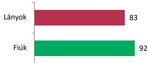
2. kép: Betegek nem szerint

A 2. kép azt mutatja, hogy a vizsgálati gyógyszerrel kezelt betegek közül hány volt lány, illetve fiú.