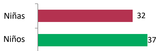
Imagen 2: Pacientes según el sexo

La imagen 2 muestra cuántos pacientes eran niños y cuántos eran niñas.