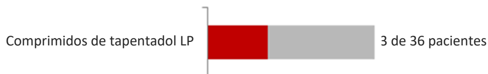
Imagen 5: Efectos secundarios a lo largo del tratamiento de hasta 12 meses

Los efectos secundarios más frecuentes durante ese periodo fueron: