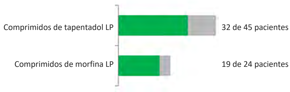
Imagen 3: Alivio claro del dolor después de los primeros 14 días de tratamiento

Estos resultados mostraron que el porcentaje de pacientes que sintió un alivio claro del dolor fue aproximadamente el mismo en los pacientes que tomaron comprimidos de tapentadol LP que en los que tomaron comprimidos de morfina LP.