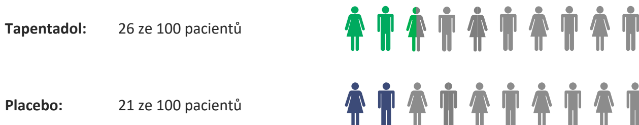
Obrázek 4: Vedlejší účinky podle léčby

Obrázek 4 ukazuje, kolik pacientů mělo jakékoli vedlejší účinky.